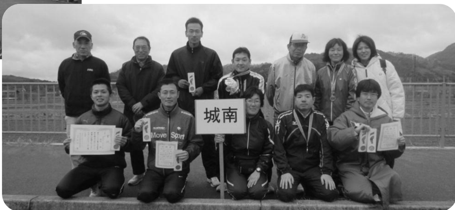
駅伝大会の選手と体育委員