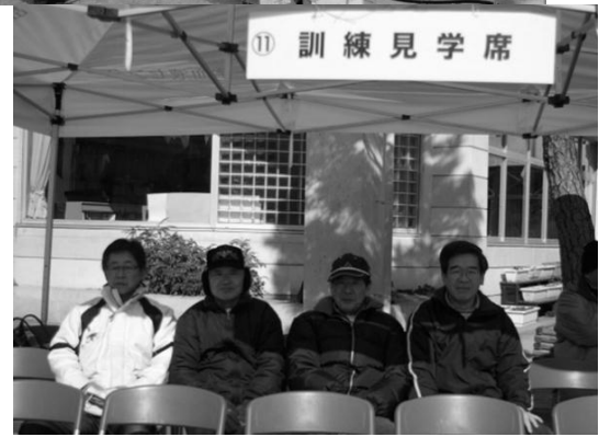
訓練に参加した城南ボランティアの皆さんと見学いただいた自治会長さんたち